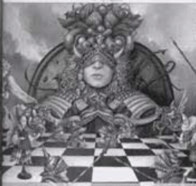
ТОМЕК SETOWSKI Портфолио стр. 22