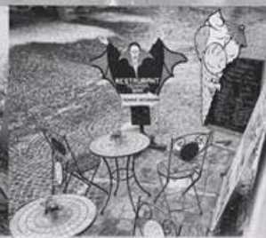
РУМЫНИЯ: ПУТЕШЕСТВИЕ ЗА ЛЕГЕНДОЙ стр. 30