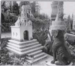
ПУТЕВОДИТЕЛЬ ПО КЛАДБИЩАМ МИРА стр. 26