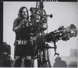
ФЕСТИВАЛИ CASTLE PARTY, SUMMER DARKNESS стр. 16