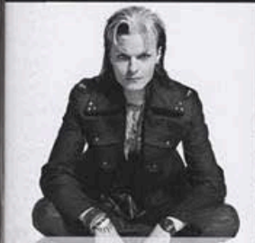
LACRIMOSA Интервью стр. 6