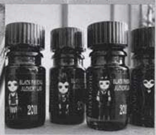
ГОТИЧЕСКАЯ ПАРФЮМЕРИЯ стр. 32