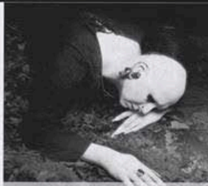
SOPOR AETERNUS Интервью стр. 8