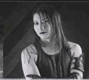
GOTHIKA Интервью стр. 10